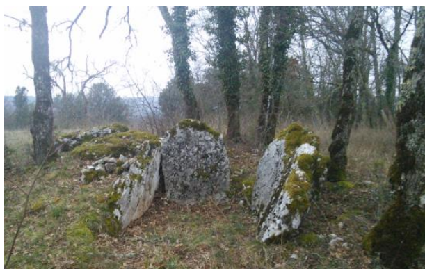
Dolmen de Cieurac, appelé aussi Dolmen des Cartayroux

Les trois dolmens implantés sur le territoire de Lanzac confirment cette présence celtique.