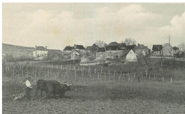
Photo d'après-guerre de la Durantie

Les campagnes se développèrent de manière significative, tout comme le patrimoine vernaculaire local (fours à pain, croix...).