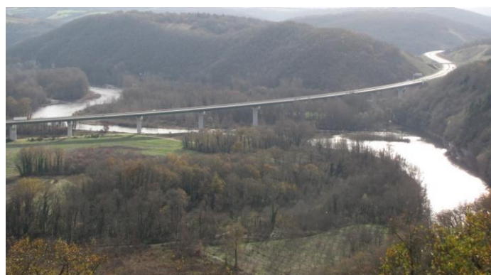
Point de vue depuis la D820