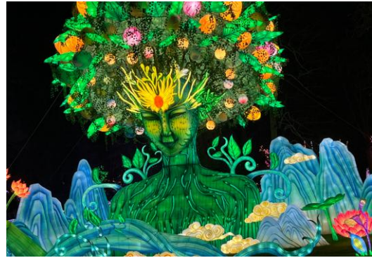
Quelques photos du festival des Lanternes de Montauban

En plus des activités régulières qui tournent à plein régime (randonnée – danse – cuisine – peinture – sorties spectacles – Art Floral) d'autres vont renaître ou voir le jour dans les mois qui viennent : un atelier « livres pliés » à découvrir le 5 mars à 9h30 Salle des Fêtes et, à l'étude, un Atelier Jeux de Société, sans oublier les cartes (tarot, belote...).