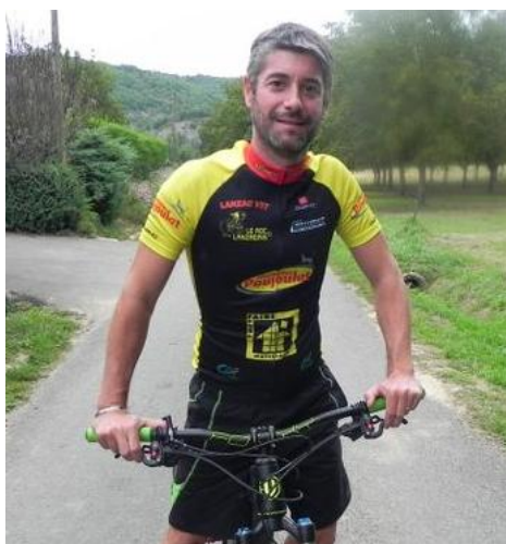
Merci Monsieur le Président

Lors de cette réunion, le conseil d'administration a été renouvelé et s'est même élargi avec 3 administrateurs supplémentaires.