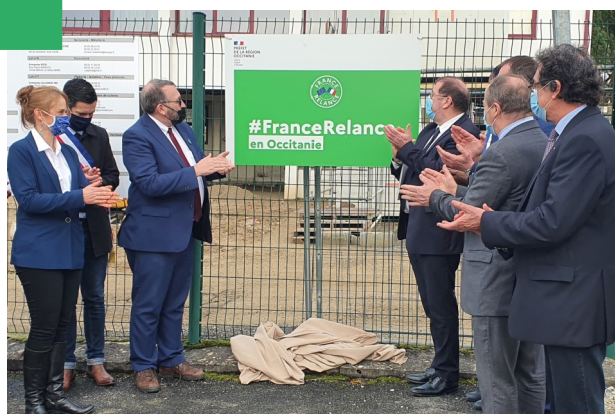
5 février 2021